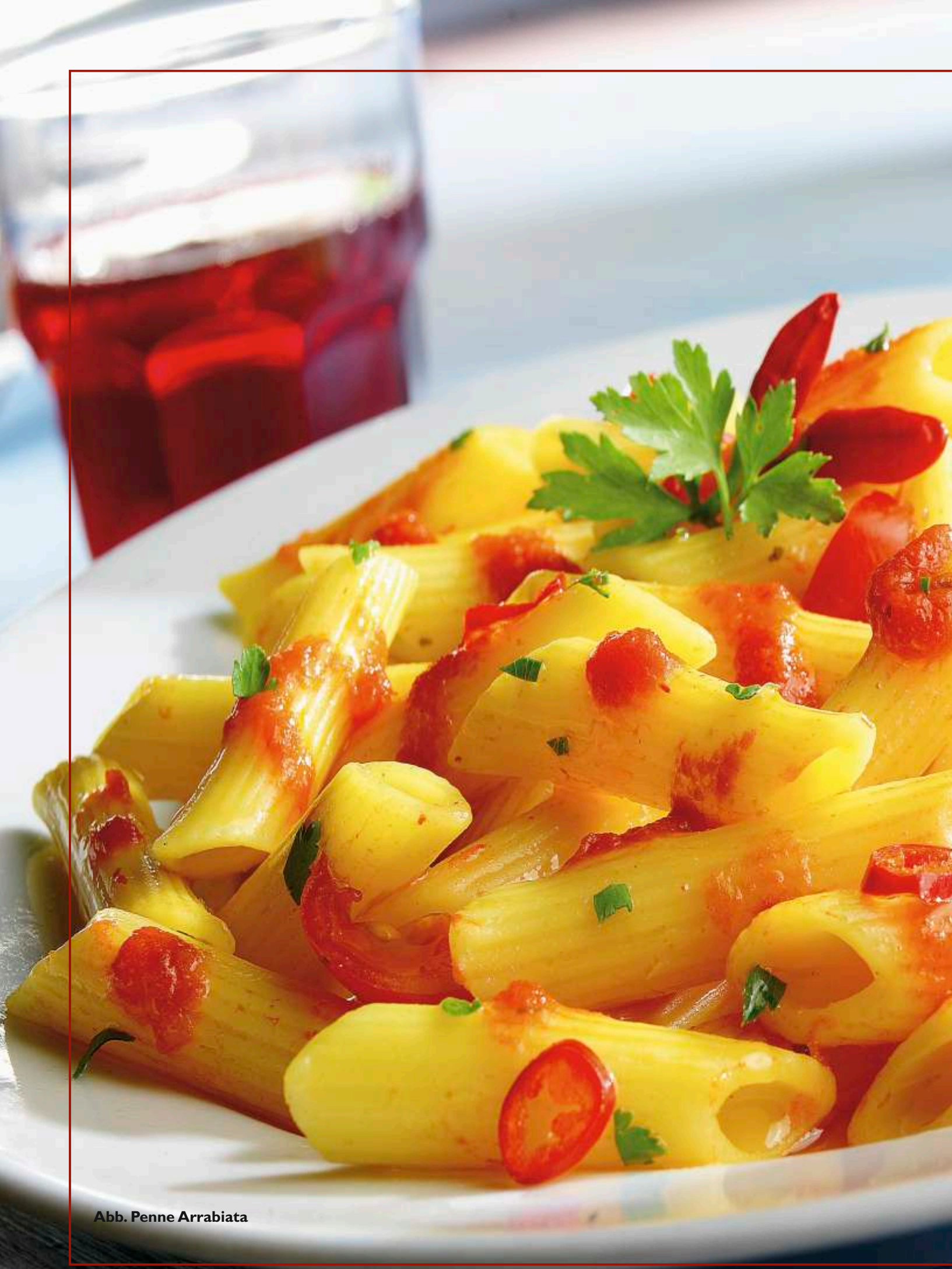
Abb. Penne Arrabiata