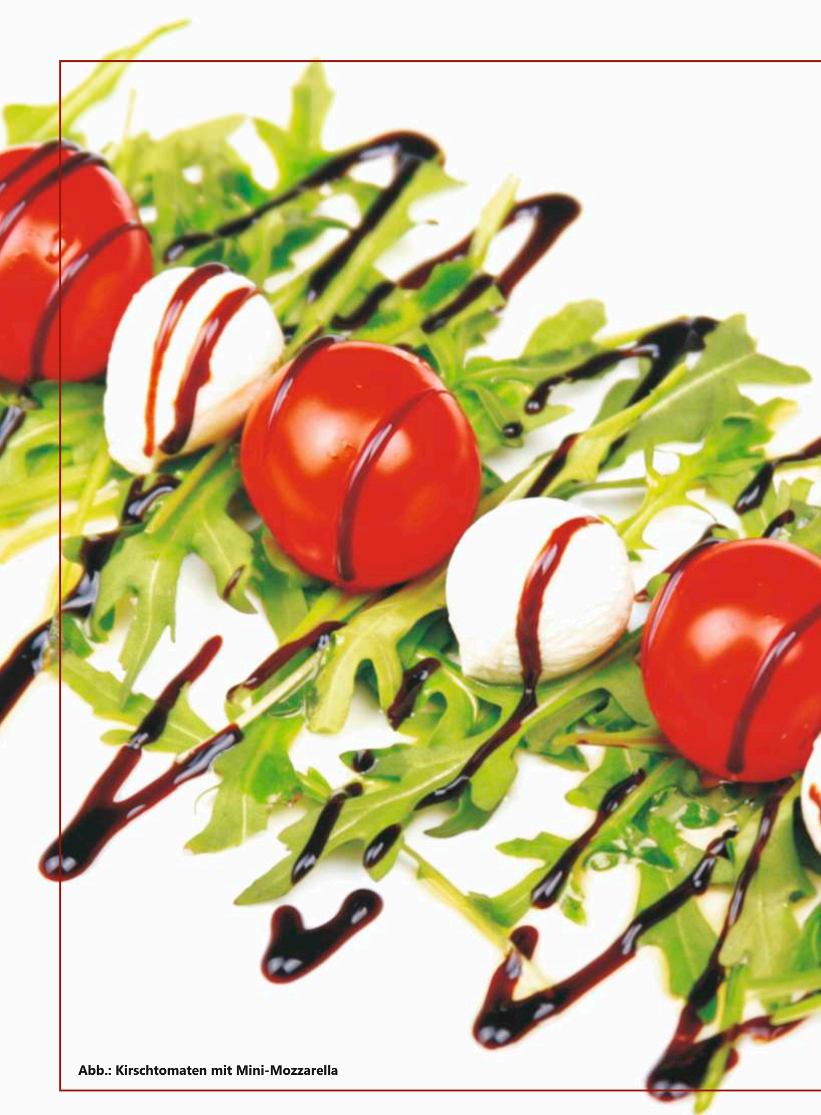
Abb.: Kirschtomaten mit Mini-Mozzarella