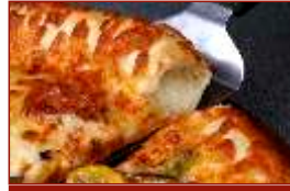
Golden Cheese Cheddar-Käse auf dem Rand