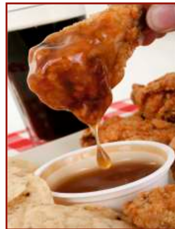
Chicken Wings 5)