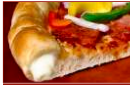
Cheese Crust Mozzarella-Käse im Rand