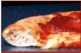
italienischer Art Dünn & Knuspriger Teig